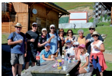
Tournoi de mini-golf