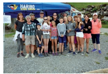
Tournoi de pétanque