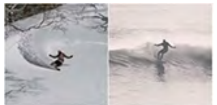
L'inspiration : la courbe parfaite sur une vague de neige.

Arare est le snowpark historique d'Avoriaz et le premier à avoir été construit en France. S'il reste un snowpark d'initiés, son concept a été complètement transformé pour lui façonner une nouvelle identité et le rendre moins élitiste, sans pour autant trahir ses origines. Son nouveau shape reproduit le style et la philosophie du surf en dessinant de grandes vagues de neige sur toute la surface du snowpark. L'objectif : réaliser la courbe parfaite avec le maximum d'aisance et de style avec la possibilité de rider des modules originaux. À découvrir absolument !