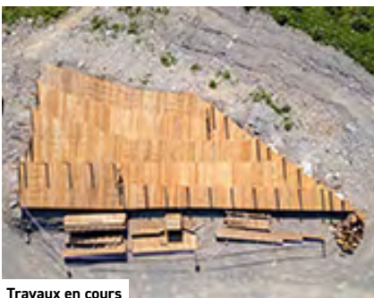
Travaux en cours

La Chapelle est le snowpark compact et accessible à tous en plein cœur de la station qui s'expose à tous les regards depuis la